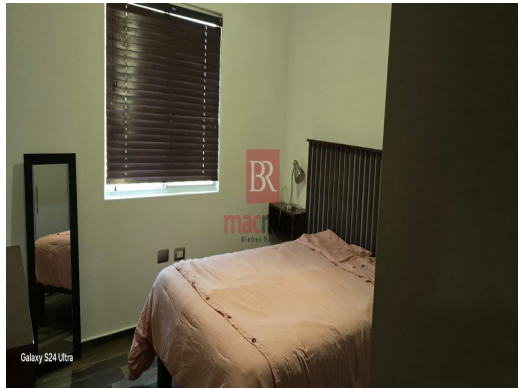
Galaxy S24 Ultra