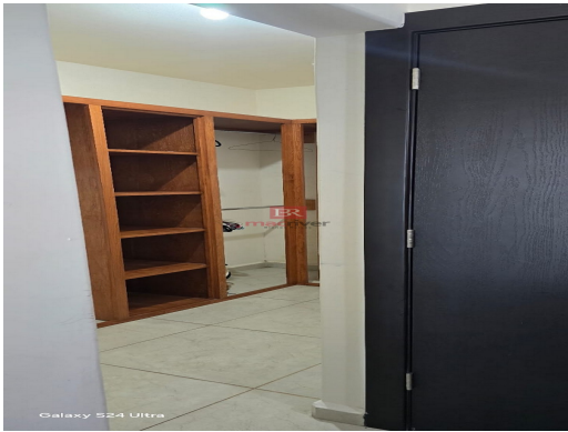
Galaxy S24 Ultra