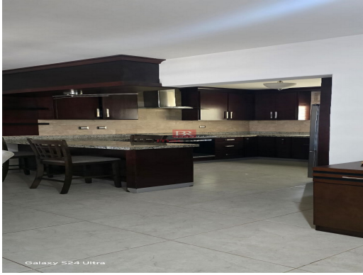
Galaxy S24 Ultra