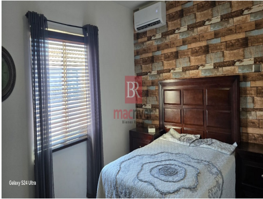
Galaxy S24 Ultra